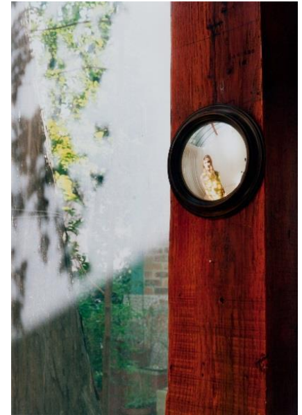
Kuvat: Helvi Ahonen 1968 / I.K.Inha 1894 / Elina Brotherus: Mirroir 2007 / SVM