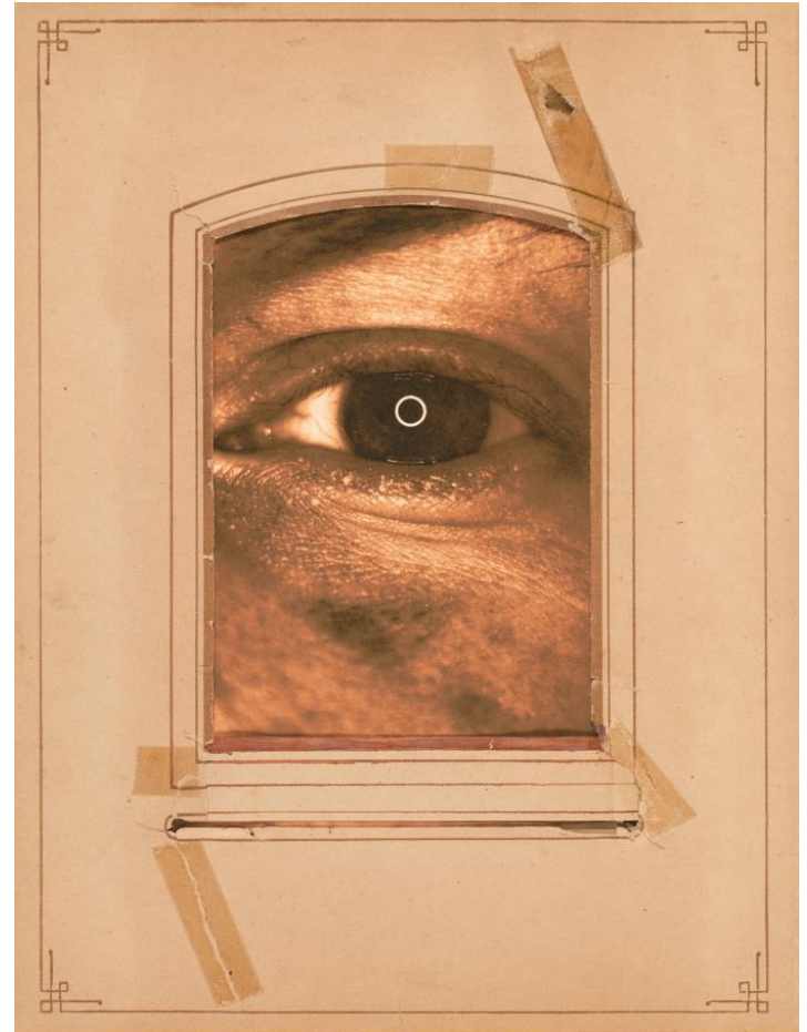
Jenni Haili: sarjasta \mu\acute{\alpha}\tau\iota , 2020. Tradeka-kokoelma, Suomen valokuvataiteen museo